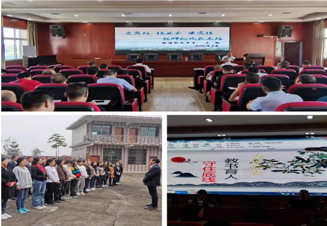
【学校教师开展丰富多样的国学课堂】

2、抓好团队教师梯队建设。遵循教师成长规律，了解教师国学基础，创新团队教师的培养模式，开展“国学能力培养”计划：展开教师层次培训、研发团队培训、任课教师培训、语文德育教师培训、德育管理教师培训、全体教师培训。按照不同层次、不同角度、不同需求去培养教师国学经典德育育人能力。