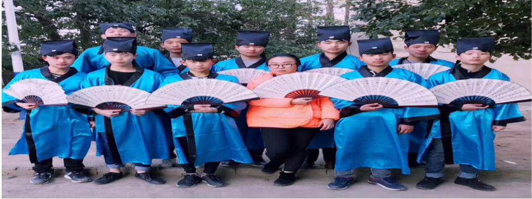
【溆浦职中国学经典德育育人团队成员指导学生参加国学朗诵比赛】