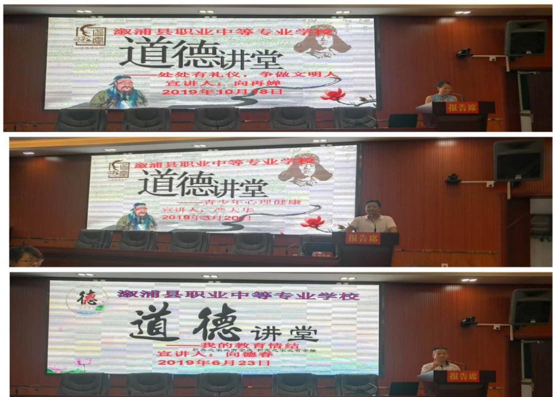
【学校教师开展系列道德讲堂活动】