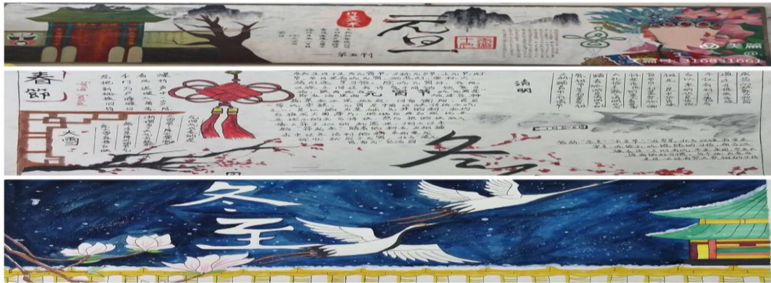
【学校板报融进国学文化，让学生感受国学】

席博学多才用典精妙，我们要经常认真学一学主席学习用典，学习用典可以增强文化自信、可以汲取政治智慧可以养浩然正气增儒雅之气。在他的带领下，党委行政一班人学习经典蔚然成风，而班子的学习风气又有力地推动了全体教师学典用典之风。