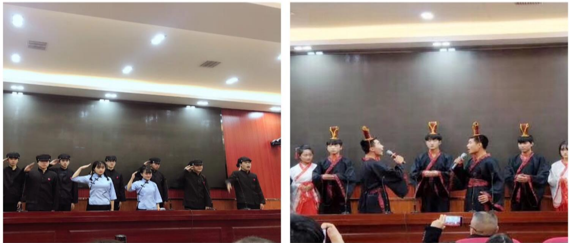
【溆浦职中开展国学经典朗诵】