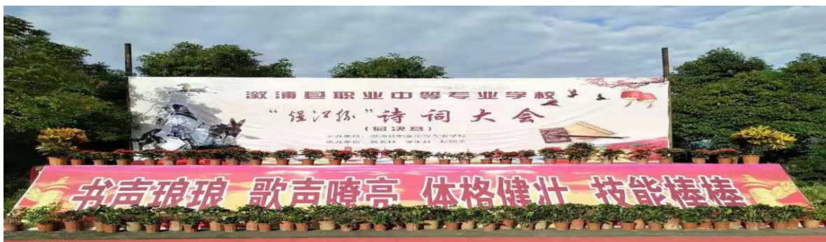
【溆浦职中举办诗词大会】