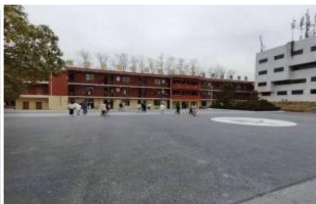
(学校办学16字训“书声琅琅、歌声嘹亮、体格健壮、技能棒棒”)