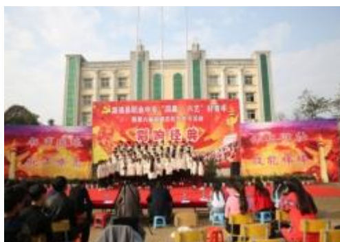
（唱响经典——红色经典篇）

创新“四晨·六艺”育人活动，贯彻国学经典理念始终。 我们结合学校学生实际，推出“四晨·六艺”育人活动模式，“四晨”即“晨读、晨练、晨歌、晨舞”，新“六艺”即“经典诵读、劳动锻炼、专业技能、校园合唱、书法绘画、个人才艺”。让学生晨读名著、晚诵经典、熟悉许多优秀事迹和经典案例，让他们内心触动，行为跟进，变得有关爱心有责任感，进而劳动积极、学习进步。安排由班主任做好每周的“四晨”课表，各班值班教师和学生干部监督推行，做好登记和评比，校园里书声琅琅、歌舞飞扬。中午和晚上的课余时间，学习传统文化，训练劳动技能，培养兴趣爱好，校园里充满浓郁的文化气息。很多学生改变了以往的不良习惯，养成了尊重他人、积极向上的良好心态，变得自信，对将来职业有了清晰规划，对未来生活充满了美好向往。